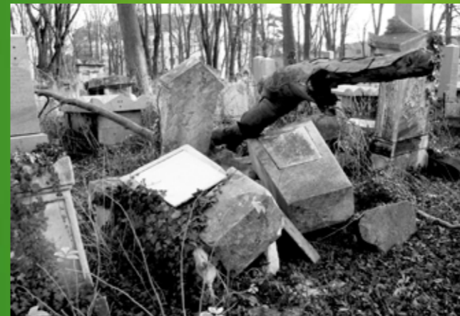
Der jüdische Friedhof in Wien-Währing.

Am 17. Jänner 2001 unterzeichnete Österreich das Washingtoner Abkommen und verpflichtete sich dadurch dazu, die jüdischen Friedhöfe im Land zu erhalten und gegebenenfalls zu sanieren. Mittlerweile sind sieben Jahre ins Land gezogen, passiert ist gar nichts.